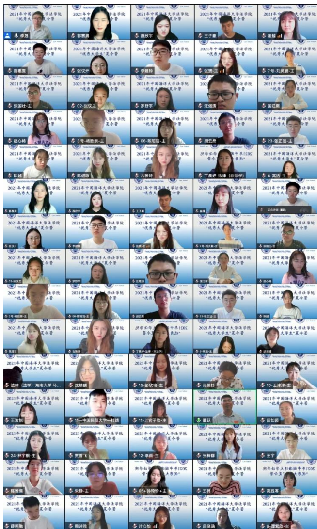
开幕式营员“云合影”