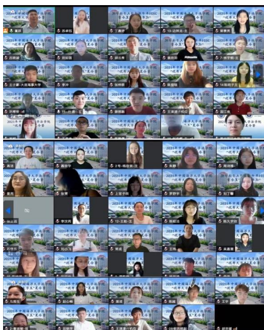
夏令营闭幕式合影3