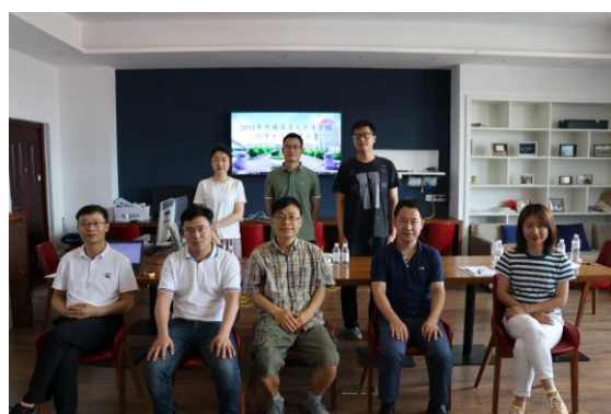
夏令营闭幕式合影1、合影2