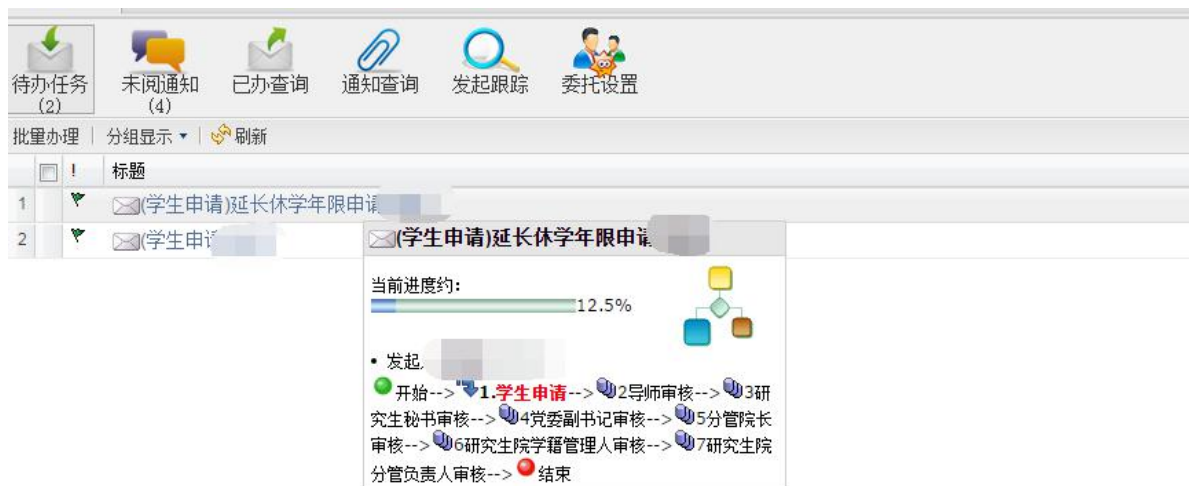
图 3-11 【延长修读年限申请流程图】