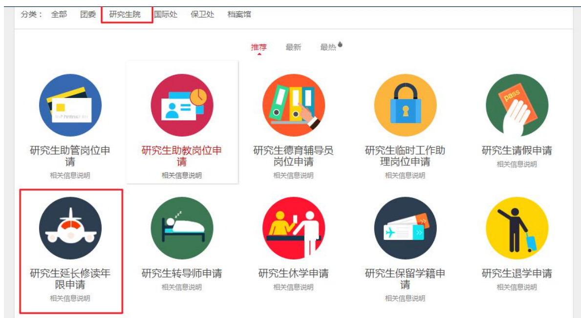
图 3-12 【进入延长修读年限申请界面】

第一步： 登录海大信息门户-网上办事大厅-依次点击【研究生院】-【研究生延长修读年限申请】，进入延长修读年限申请；