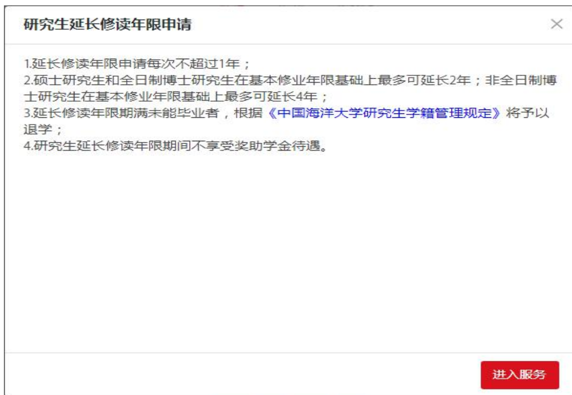
图 3-13 【延长修读年限相关说明界面】